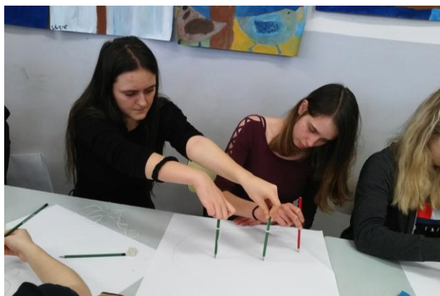
Dotkněte se kuželoseček 2020