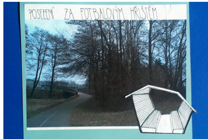
Jsme nad Sázavou v rámci projektu Živé proStory 2019