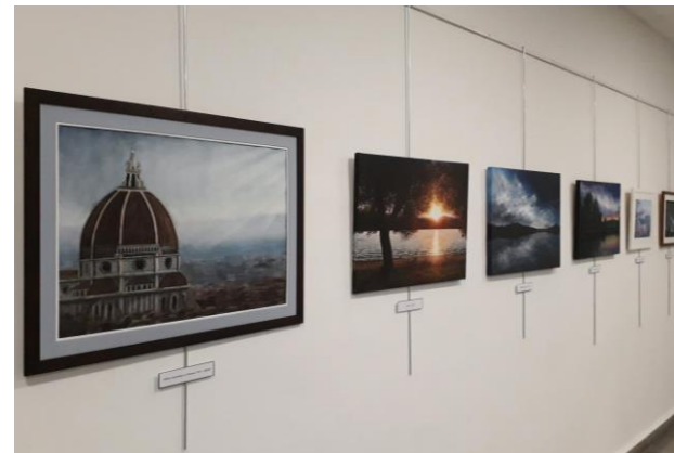
Výstava obrazů studenta Matěje Ubra 2020