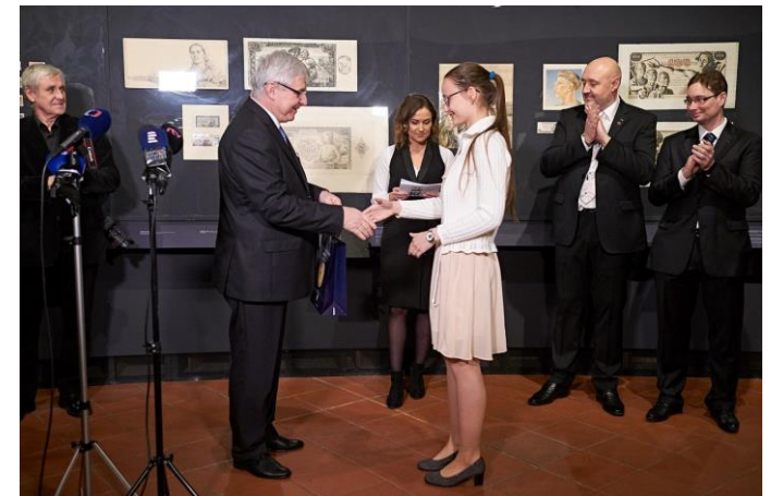
Soutěž ČNB 2019