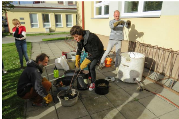
Raku (keramika) pro radost 2019