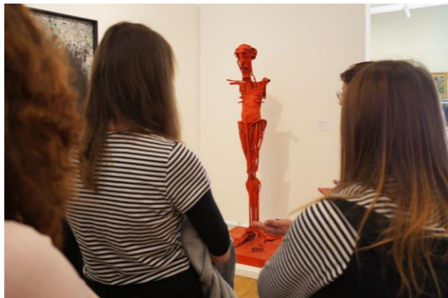
Exkurze do Hradce Králové 2019