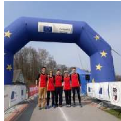
Učitelská štafeta na JMC