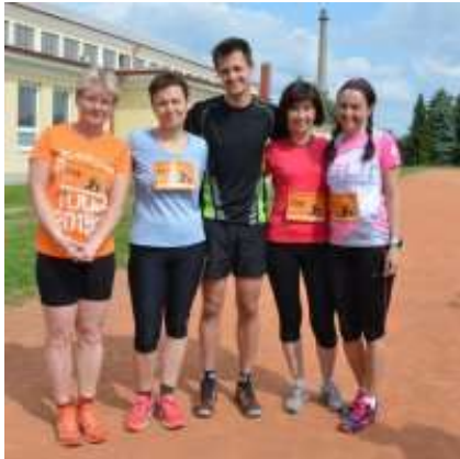
Běh pro Afriku